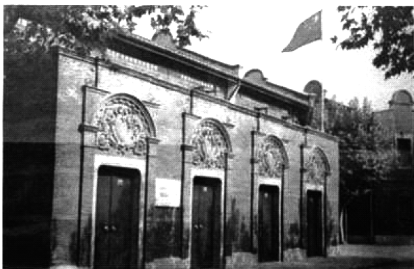
图3 中国共产党第一次全国代表大会会址

1921年, 中国共产党第一次全国代表大会在上海召开, 共有13名代表出席。大会通过纲领, 明确了中国共产党的奋斗目标是推翻资产阶级, 建立无产阶级专政, 实现社会主义和共产主义。一大召开标志着中国共产党的正式成立, 是开天辟地的大事变。中国共产党的成立, 使中国革命有了坚强的领导力量。中国革命的面目就焕然一新了。